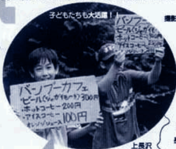
子どもたちも大活躍!

毎年、家族ぐるみで参加しています。山仕事のプロ、山の幸を美味しく料理するご婦人たち、楽しみミュージシャン、暑くから来てくださる観客の皆様。今年はどんな人に出会い、どんなコンサートをつくることができるか、楽しみにしています。