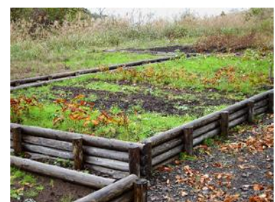
ドングリから育てたブナの苗床

最初の「バースデーランド」が森吉山に誕生します。 四季折々に美しい表情を見せてくれる森吉山。花の百名山ともいわれるこの山の山麓に最初の「バースデーランド」が誕生します。一本の木とつながることで森とつながります。みんなが森に心のふるさとを持つこと、それがバースデーランドです。新しい森の価値をそこでつながる人たちと一緒に考えていきたいと思っています。あなたが植えたブナの苗木には、あなたの名前と誕生日カードが添えられあなたのバースツリーとなります。6月4日はバースデーランドを創りましょう。