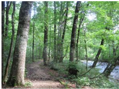
森吉山から太平洋に流れる小さな川 ノロ川添い広がるブナ林