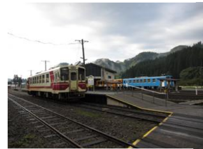
内陸縦貫鉄道の「阿仁合(あにあい)」駅