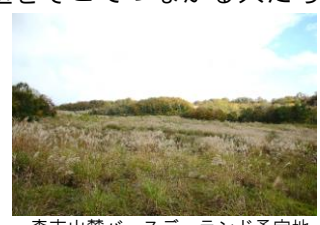
森吉山麓バースデーランド予定地

最初の「バースデーランド」が森吉山に誕生します。 四季折々に美しい表情を見せてくれる森吉山。花の百名山ともいわれるこの山の山麓に最初の「バースデーランド」が誕生します。一本の木とつながることで森とつながります。みんなが森に心のふるさとを持つこと、それがバースデーランドです。新しい森の価値をそこでつながる人たちと一緒に考えていきたいと思っています。あなたが植えたブナの苗木には、あなたの名前と誕生日カードが添えられあなたのバースツリーとなります。6月4日はバースデーランドを創りましょう。